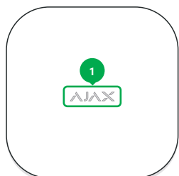
1 - Logo mit Leuchtanzeige